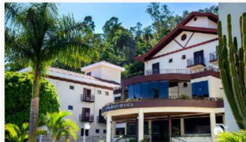
Hotel Recanto Bela Vista