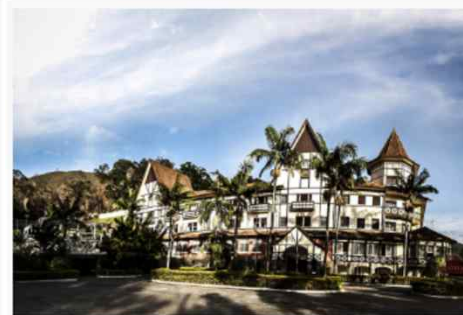
Grande Hotel Gloria